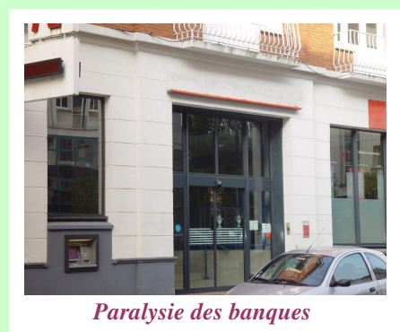
Paralysie des banques

Les États parent au plus urgent en soutenant les banques de diverses manières et en les aidant à assainir leur bilan ; pour stimuler la croissance ils mettent en place des plans de relance de montants jamais observés.