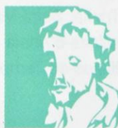
Association Saint Benoît Labre