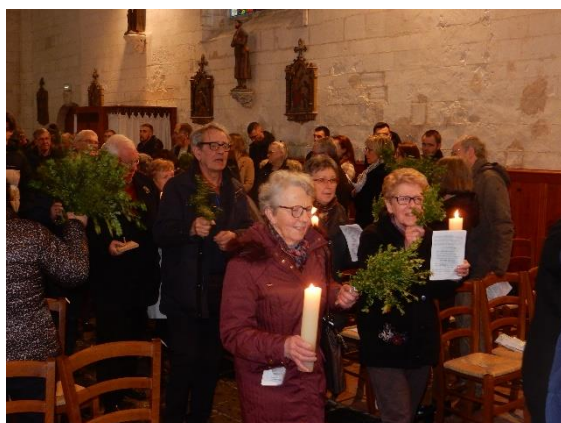
Dimanche de Rameaux : messe anticipée célébrée dans l'église d'Habarcq.