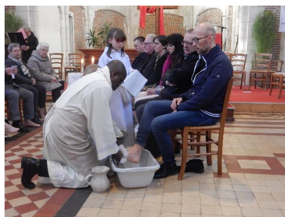
Jeudi Saint : célébration de la Cène et rite du lavement des pieds dans l'église de Maroeuil.