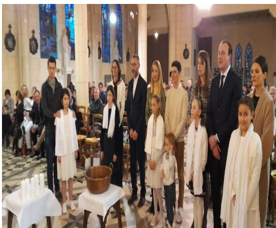
Samedi Saint : Veillée pascale et baptêmes de cinq catéchumènes dans l'église de Neuville Saint Vaast.