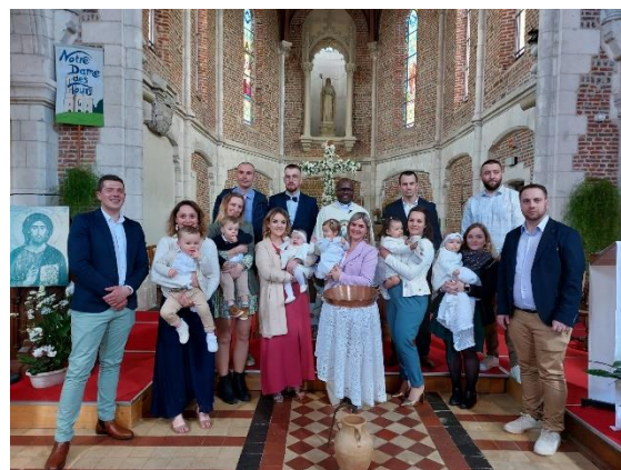
Dimanche de Pâques : Baptêmes de six enfants dans l'église de Maroeuil.