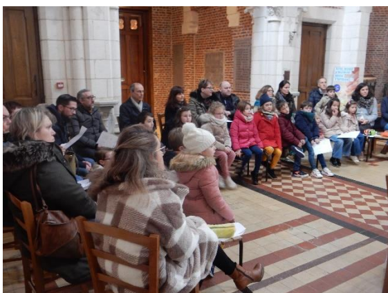
Dimanche de Pâques : Séance de Graine de Parole avec 15 familles dans l'église de Maroeuil.