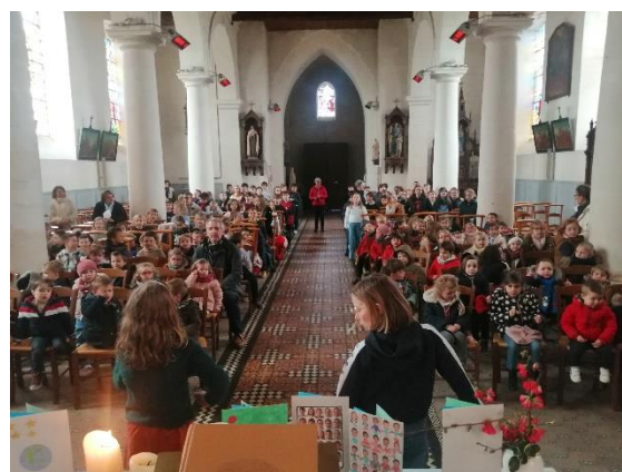
Mardi de Pâques : célébration de Pâques avec les élèves de l'école Sainte Marie de Duisans.