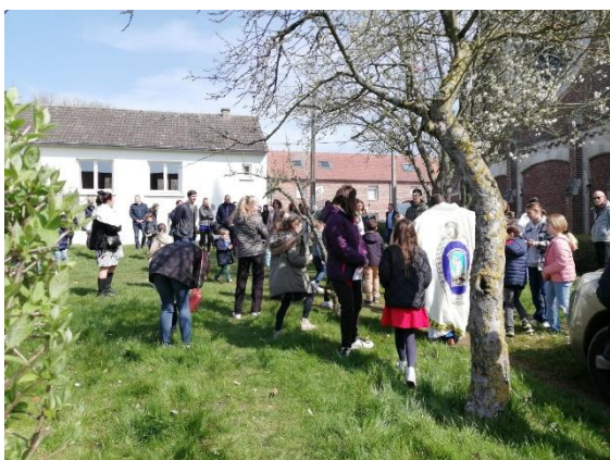
Dimanche de Pâques : Après la messe, chasse aux œufs de Pâques dans le jardin du presbytère par les enfants et les jeunes.