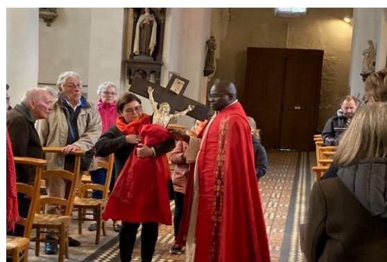
Vendredi Saint : Vénération de la Croix dans l'église de Duisans.