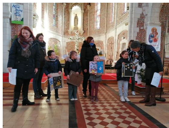
Jeudi de Pâques : célébration de Pâques avec les écoles Sainte Jeanne D'Arc de Neuville et Sainte Bertille de Maroeuil.