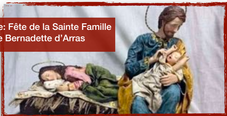
Scène de la nativité aimée du Pape François. Unique en son genre, joliment nommée « Que maman se repose ».

Dimanche 26 décembre: Fête de la Sainte Famille 11h: messe à Ste Bernadette d'Arras