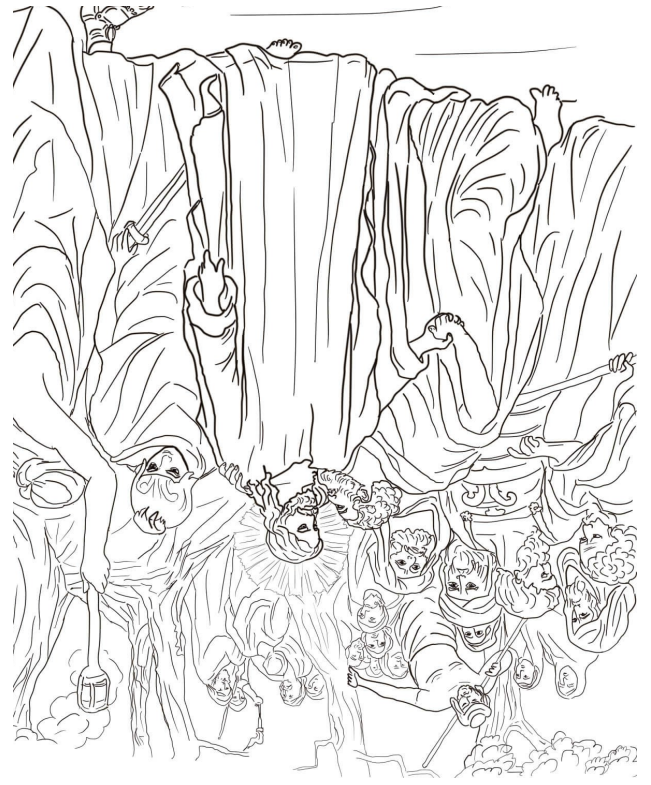
PAR UN BAISER...