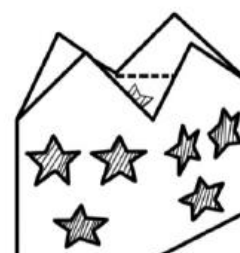
La lanterne montée