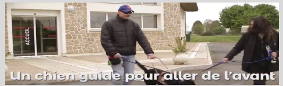
Un chien guide pour aller de l'avant