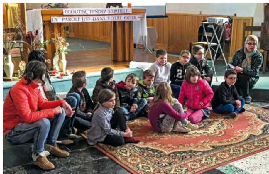
~ Dans l'église Saint-Martin à Auchel le 28 février 2016.

Lors de ce dimanche Parole en fête, nous avons découvert l'Évangile de Luc : il nous invite à changer notre regard sur Dieu.