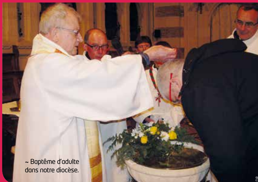
~ Baptême d'adulte dans notre diocèse.