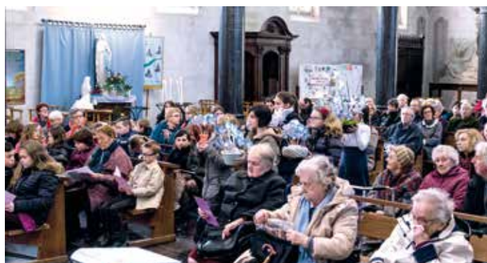
~ Dimanche 7 février 2016 à Auchel.