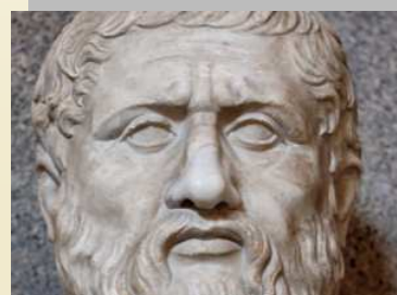
Aristote IV e av. JC