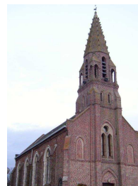
Drouvin le Marais

Consulter le site http://arras.cef.fr/rubrique-102-notre-dame-bethunois.html