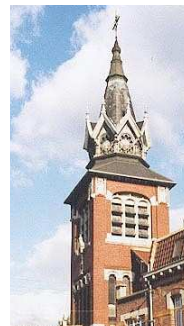
Notre-Dame du Perroy