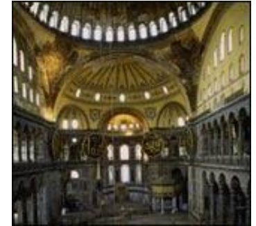
Intérieur de la basilique Sainte-Sophie (Istanbul)