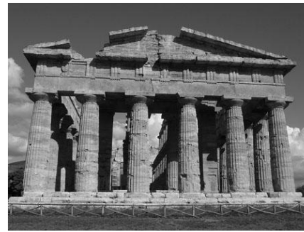
Temple grec de Paestum

On reconstruit une architecture monumentale et disciplinée à laquelle on reproche parfois de manquer de spontanéité et d'émotion mais jamais de grandeur !