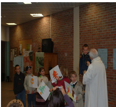
Les enfants montrent leurs créations et donnent leur avis... Au lycée agricole d'Aire sur la Lys

Sur le thème « vie d'équipe, vie de mouvement », des responsables ACE participaient à la journée fédérale du CMR (Chrétiens en Monde Rural). Pour les enfants présents, ils animaient jeux et ateliers en lien avec ce thème. Les enfants et anims sont intervenus à la