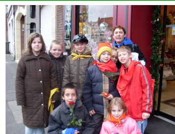
Devant La boulangerie

« Cet échange était plutôt voulu comme amical, pas pour échanger simplement un bien. »