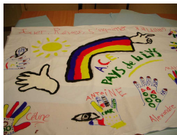
Fresque des enfants

célé pour montrer ce qu'ils ont fait et présenté le thème d'année ACE et une danse rythmée sur un chant connu de l'ACE.