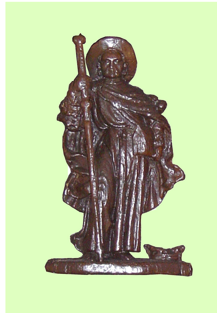
SCULPTURE FIGURANT SUR L'ANCIENNE CHASSE DE SAINT-JOSSE (1640) AIRON-NOTRE_DAME

NEUVAIN DE SAINT-JOSSE SUR MER Du 23 au 31 mai 2021