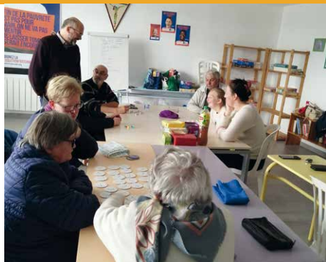
Table ouverte partagée à Desvres

Toutes les six semaines se retrouve une douzaine de personnes au local du Secours catholique, pour la Top (table ouverte partagée).