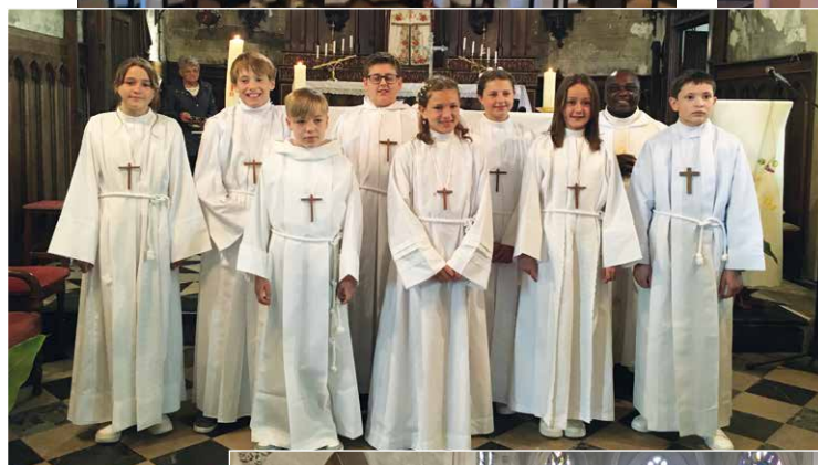
~ Le Wast.