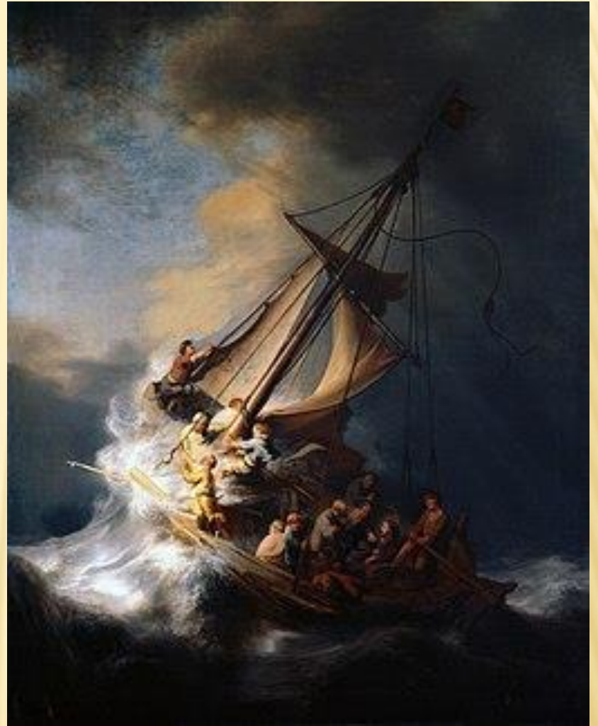
REMBRANDT (1606-1669) HUILE SUR TOILE BOSTON, VOLÉE EN 1992