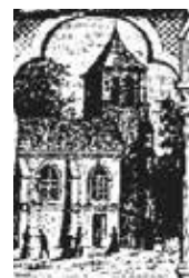
~ L'ancienne église

Avec de tels fonts baptismaux, il n'est pas question de procéder à des baptêmes par immersion complète comme aux premiers temps ou sous d'autres cieux au climat plus cléments. Chez nos frères chrétiens de confession baptiste, le baptême n'est conféré qu'à des adultes et se fait par immersion comme nous avons pu en être témoin au temple de Bruay à l'occasion du baptême d'un migrant irakien d'origine musulmane