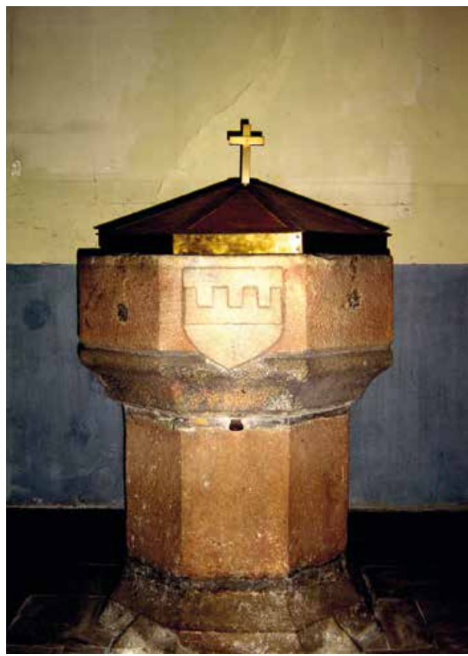
~ les fonts baptismaux