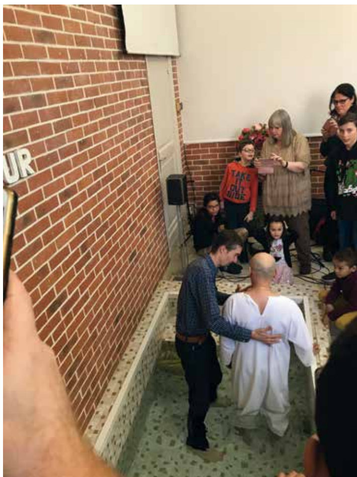
~ le temple de Bruay baptême d'adulte