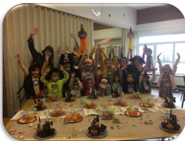
« Pirates des Caraïbes »