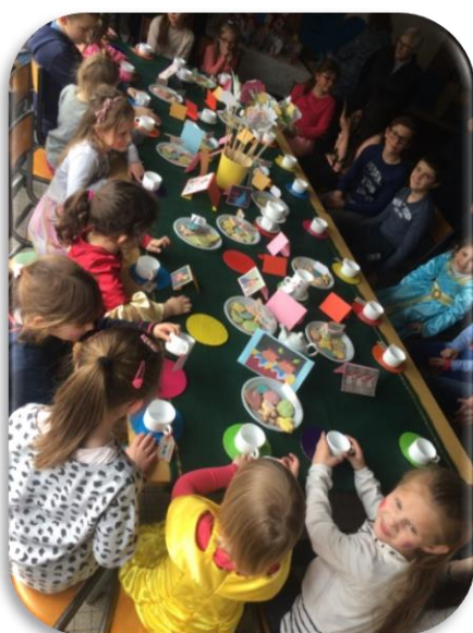
« Alice aux pays des merveilles »