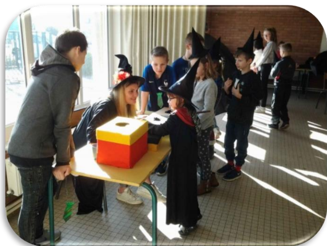
« Harry Potter »

Il paraîtrait même qu'un club régulier sera créé dès la rentrée de septembre !