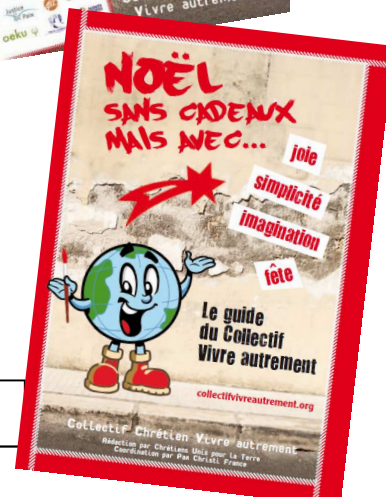
Un livret de 24 pages