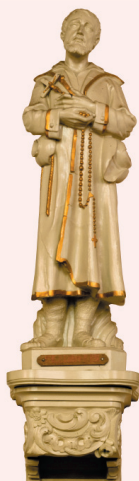
Statue Benoît Labre Eglise de Calonne