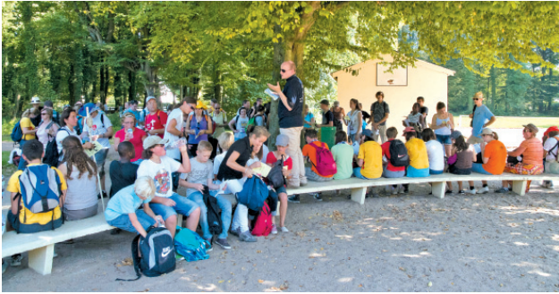
Pique-nique au Bois Saint-Pierre.