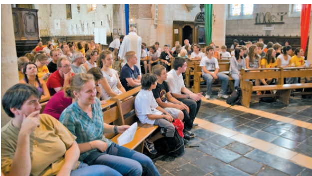
La célébration eucharistique à Amettes.

A la marche d'Amettes, je me suis bien amusée, il y avait une très bonne ambiance !