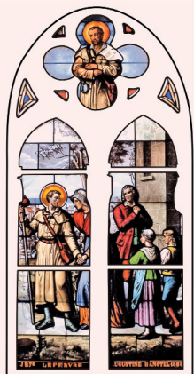
Vitrail Benoît Labre Eglise d'Auchel