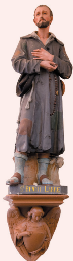
Statue Benoît Labre Eglise de Marles

Paroisse Notre Dame de la Clarence en Auchellois