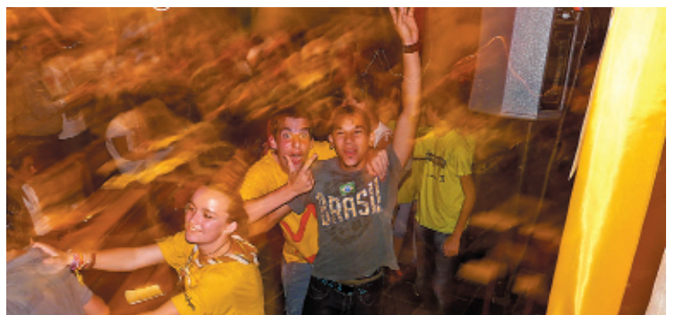
La soirée musicale.