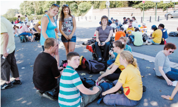
Pause partage en groupes à Ferfay.