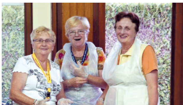
La restauration au cours de cette semaine était assurée par une équipe de bénévoles.