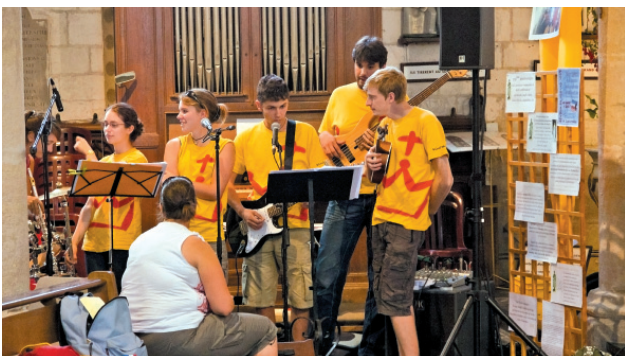
Le groupe de jeunes musiciens.