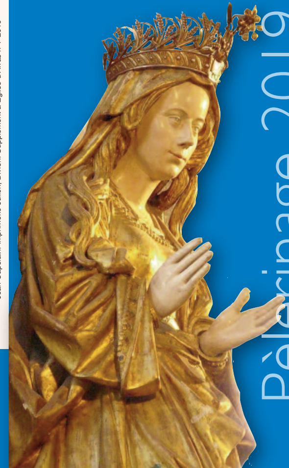
Jean Capelâin. Imprimerie Julien, Divion. Supplément à Église d'Arras n°7-2019