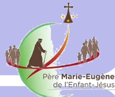
Père Marie-Eugène de l'Enfant-Jésus

Inscription pour le repas au 03 21 04 12 30 (Abbaye)