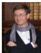
Table ronde avec :